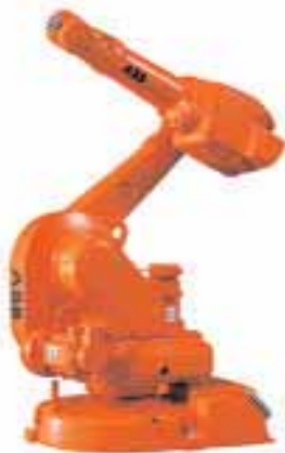
ABB IRB 1600

Tras la labor investigadora llega la calma, o lo que es lo mismo: la presentación en el mercado de las novedades para su comercialización. En definitiva, son nuevos robots que resuelven lo que otros hasta el momento no pudieron. No son muchas las compañías que han apostado por este campo de actividad. En palabras de Carlos Balaguer, catedrático de Ingeniería de Sistemas y Automática de la Universidad Carlos III de Madrid, “Japón es el gran consumidor pero la fabricación está asentada en Europa”.