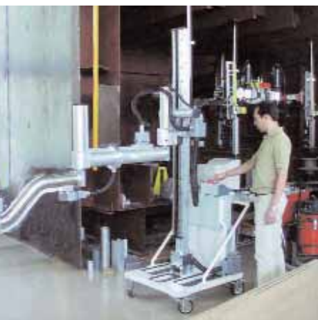
La automoción reduce costes y mejora los procesos industriales en la empresa.

casi una cuarta parte de los vehículos en proceso de retirada actualmente". Además, insiste en que "es transferible a diversos sectores, como los electrodomésticos, los aparatos electrónicos, la maquinaria industrial u otros campos de la automoción".