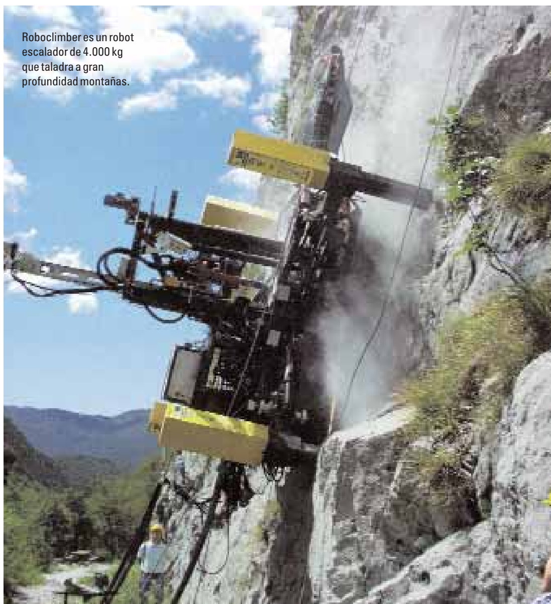
Roboclimber es un robot escalador de 4.000 kg que taladra a gran profundidad montañas.

Desde el Instituto ai2 prevén contar con un prototipo para final del presente año de cara a plantear su posible comercialización el próximo ejercicio. Mellado matiza que en principio “se pretende aplicar el sistema a cuatro modelos concretos, que representan